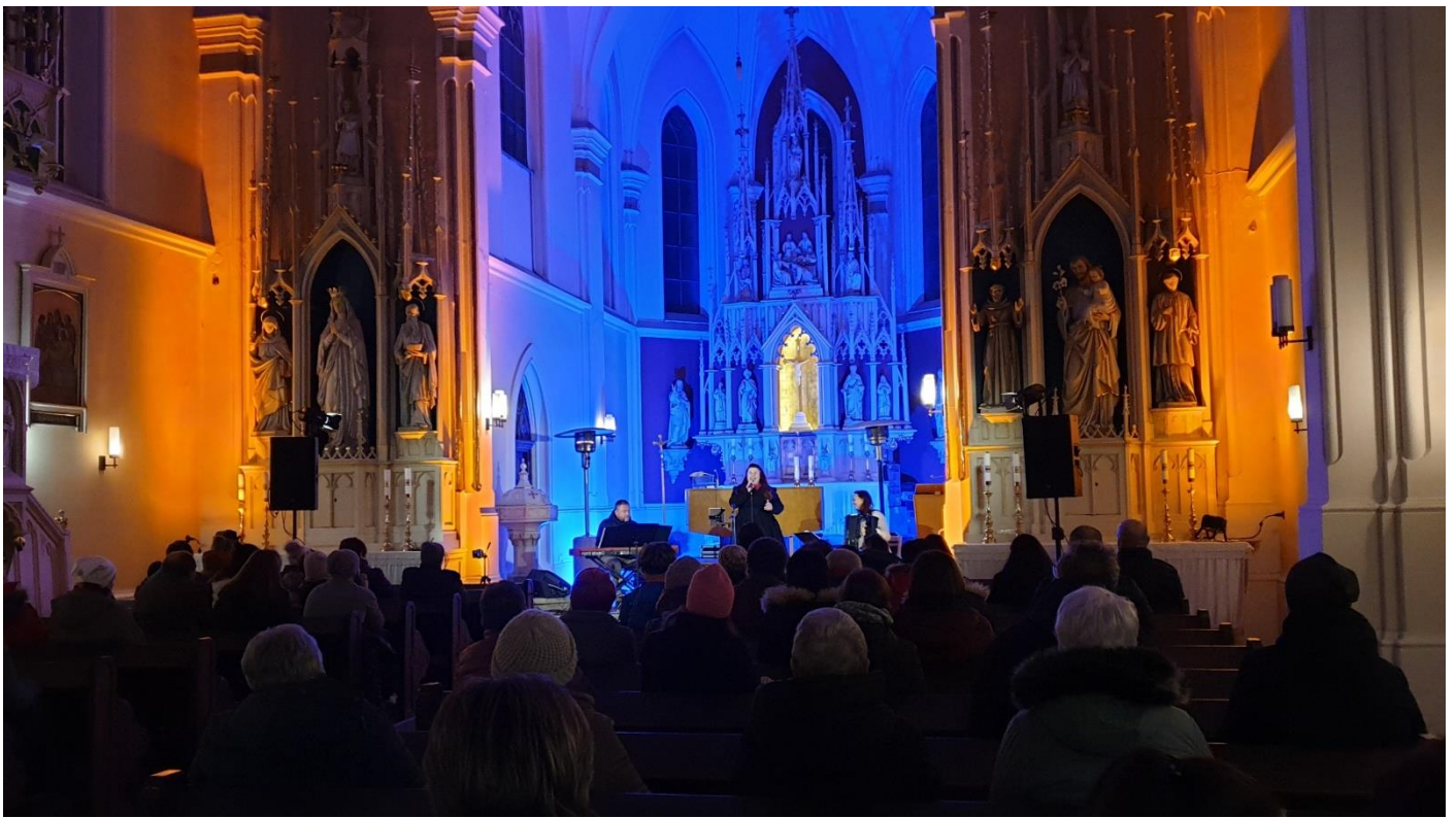
Adventní koncert v kostele sv. Maří Magdaleny v Pustějově