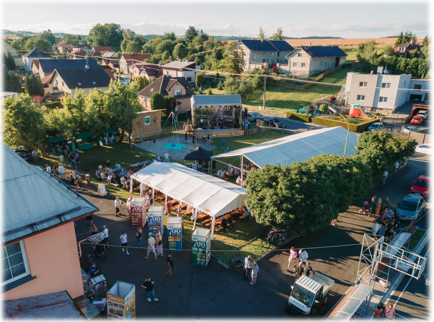
Areál sokolovny při oslavách 700 let založení obce Pustějova